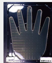
電解水を使うと除菌されている