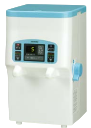
バッチ式モデル ラボⅡ