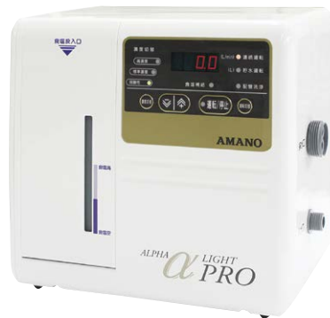
電解水生成装置 αLight PRO

手をかざすだけで電解水が生成されるので、非常に衛生的です。洗浄水・除菌水をボタンひとつで選択可能です。