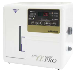
多機能コンパクトモデル αLight Pro