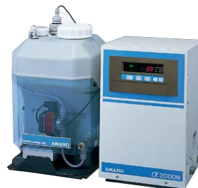
システム対応モデル α2000N