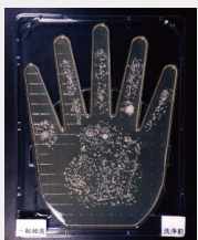
多くの菌が付着している