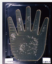
石鹸を使っても除菌はされない