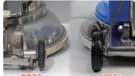
今までの 12"ポリッシャー